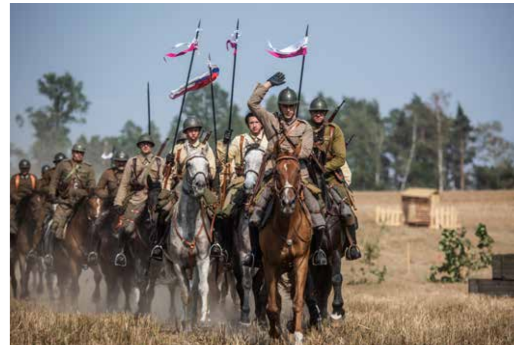
Inscenizacja szarzy 18 Pułku Ułanów Pomorskich pod Krojantami - impreza plenerowa współfinansowana przez Gminę Chojnice i Ministerstwo Obrony Narodowej

Strategia, którą mam nadzieję za chwilę przyjmie, będzie dla nas punktem odniesienia do dalszych działań i aktywności. Pozwoli również uwzględnić interesy różnych grup społecznych i daje szerszą perspektywę na rozwój w przyszłości. To bardzo ważne z punktu widzenia mieszkańców i samorządu, który wspólnie tworzymy.