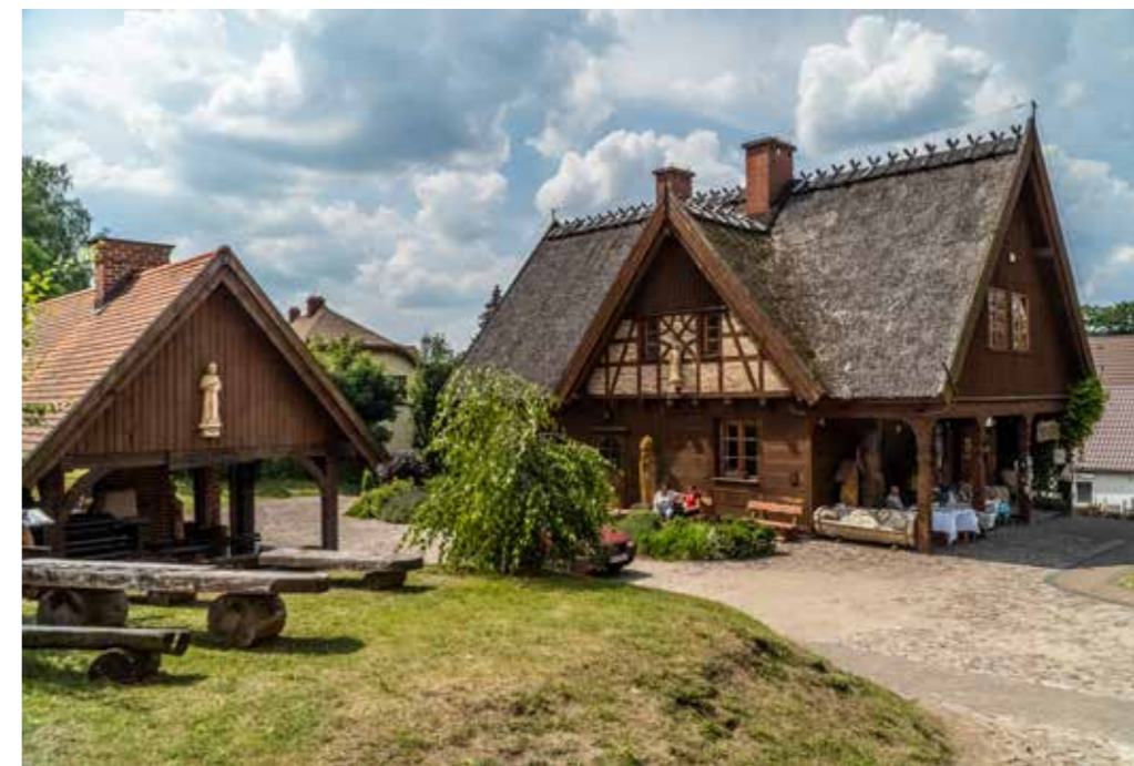
Kaszubski Dom Rękodzieła Ludowego w miejscowości Swornogacie

Cele strategiczne rozwoju Gminy Chojnice oparliśmy o trzy wymiary: społeczny, gospodarczy i przestrzenny. Z punktu widzenia naszej wspólnoty istotne było w pierwszej kolejności sprecyzowanie misji i wizji dla dynamicznie rozwijającego się samorządu. W toku prac nad strategią sformułowaliśmy misję w ten sposób: „Gmina Chojnice chroni środowisko naturalne oraz zachowuje zasady zrównoważonego rozwoju, gwarantuje wysoką jakość życia mieszkańców, a także wykorzystuje znaczącą wartość potencjału turystycznego.” Natomiast jeśli chodzi o wizję to przyjęliśmy, że „W 2030 roku Gmina Chojnice będzie zapewniać mieszkańcom wysoki standard jakości życia w optymalnych wa-