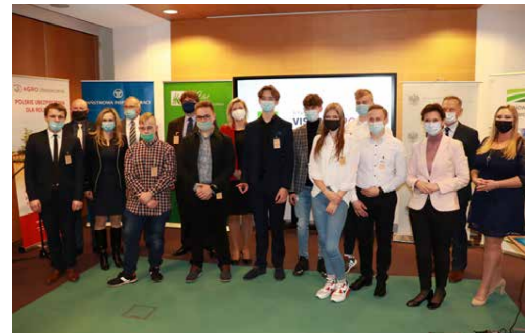
Laureaci III Ogólnopolskiego Konkursu dla Młodzieży „Moja Wizja Zero – Rolnik Liderem Bezpieczeństwa” ze współorganizatorami i fundatorami nagród

Współorganizatorami i fundatorami nagród w konkursie są: Ministerstwo Rolnictwa i Rozwoju Wsi, Państwowa Inspekcja Pracy, Poczta i Telekomunikacja, Fundacja PGE, Agencja Restrukturyzacji i Modernizacji Rolnictwa, Krajowy Ośrodek Wsparcia Rolnictwa. Konkurs odbywa się pod honorowym patronatem Ministra Rolnictwa i Rozwoju Wsi oraz patronem medialnym TVP Info.