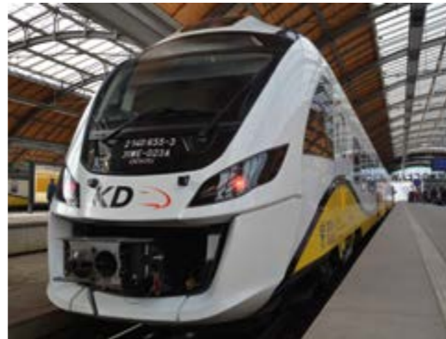
Nowe pociągi będą specjalnie przedłużone, pięcioczonowe, dzięki czemu pomieszczą ponad pół tysiąca podróżnych.

dernizację linii kolejowych. W sumie na rewitalizację infrastruktury kolejowej przeznaczymy w budżecie województwa ponad 300 mln złotych. Jedną z inwestycji, która lada dzień poprawi jakość podróżowania mieszkańców Dolnego Śląska jest zakup nowoczesnych pociągów. Na początku tego roku marszałek Cezary Przybylski podpisał umowę na 11 nowoczesnych składów, które wzmocnią ofertę przewozową Kolei Dolnośląskich. Nowe pociągi będą specjalnie przedłużone, pięcioczonowe, dzięki czemu pomieszczą ponad pół tysiąca podróżnych.