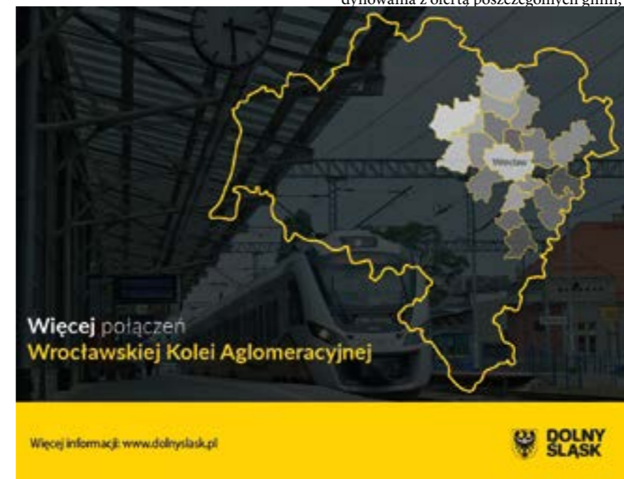
W ostatnim czasie porozumienie w sprawie Wrocławskiej Kolei Aglomeracyjnej podpisało ponad dwadzieścia gmin