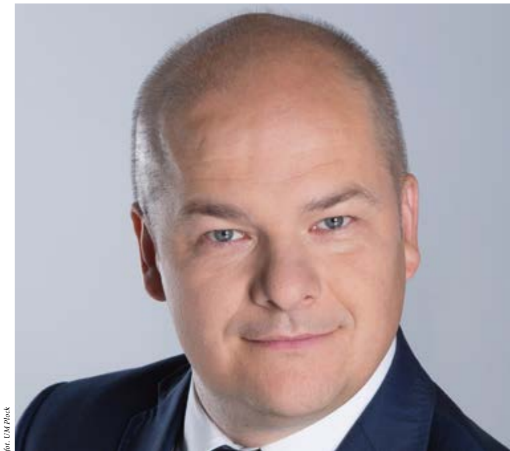
for. UM Płock

Gdybyśmy popatrzyli bez komentarza w budżet Płocka to mogłoby się wydawać,