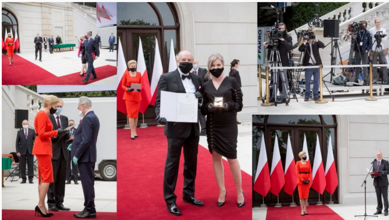
Konkurs Teraz Polska – 30 edycja

Niebagatelne znaczenie dla Laureatów ma także fakt wyjątkowej oprawy jaka co roku towarzyszy wręczeniu nagród. Przyznanie prawa do posługiwania się znakiem „Teraz Polska” odbywa się podczas Gali w Teatrze Wielkim w Warszawie. Wyjątkiem była ubiegłoroczna uroczystość, która odbyła się w Pałacu Prezydenckim na zaproszenie Pierwszej Damy. Oprócz statuetek zwycięzcy Konkursu otrzymują wsparcie medialne. Jest to możliwe dzięki współpracy Fundacji z najważniejszymi krajowymi redakcjami. Ekwiwalent reklamowy Laureatów Konkursu „Teraz Polska” w mediach jest znaczący i w wielu przypadkach skutecznie wspiera działania przedsiębiorców dotyczące kampanii promocyjnych nagrodzonych produktów i usług. Fundacja wydaje własnym nakładem „Magazyn Teraz Polska” oraz prowadzi serwisy internetowe, na łamach których promuje dokonania Laureatów Konkursu „Teraz Polska”.