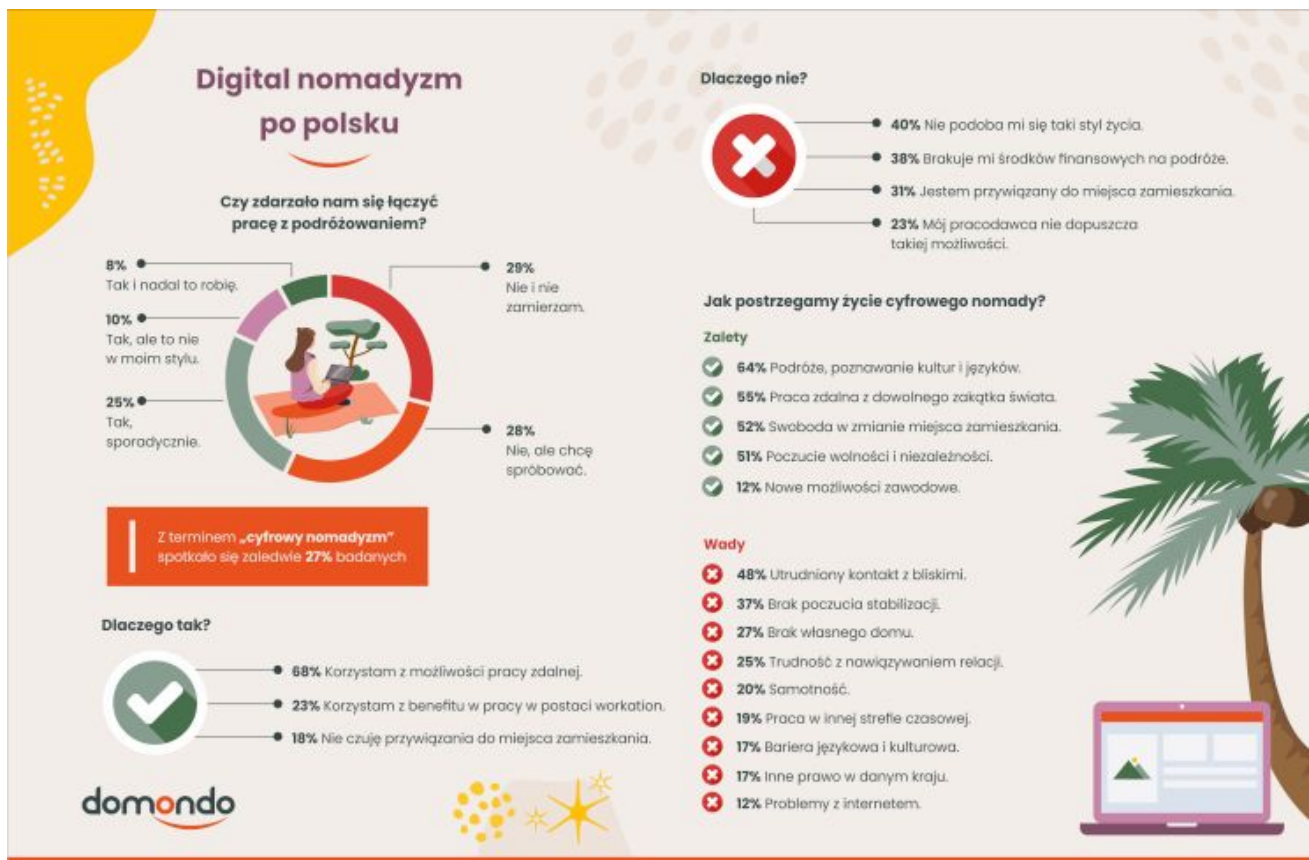
Digital nomadyzm po polsku infografika Domondo

Moda na cyfrowy nomadyzm dotarła także do Polski. Łączenie pracy zdalnej z podróżami deklaruje obecnie 8% badanych, natomiast jakiegokolwiek doświadczenia z tym związane ma znacznie więcej osób. Okazuje się, że oprócz kwestii finansowych czy zawodowych, przed wyjazdem często powstrzymuje nas przywiązanie do miejsca zamieszkania.