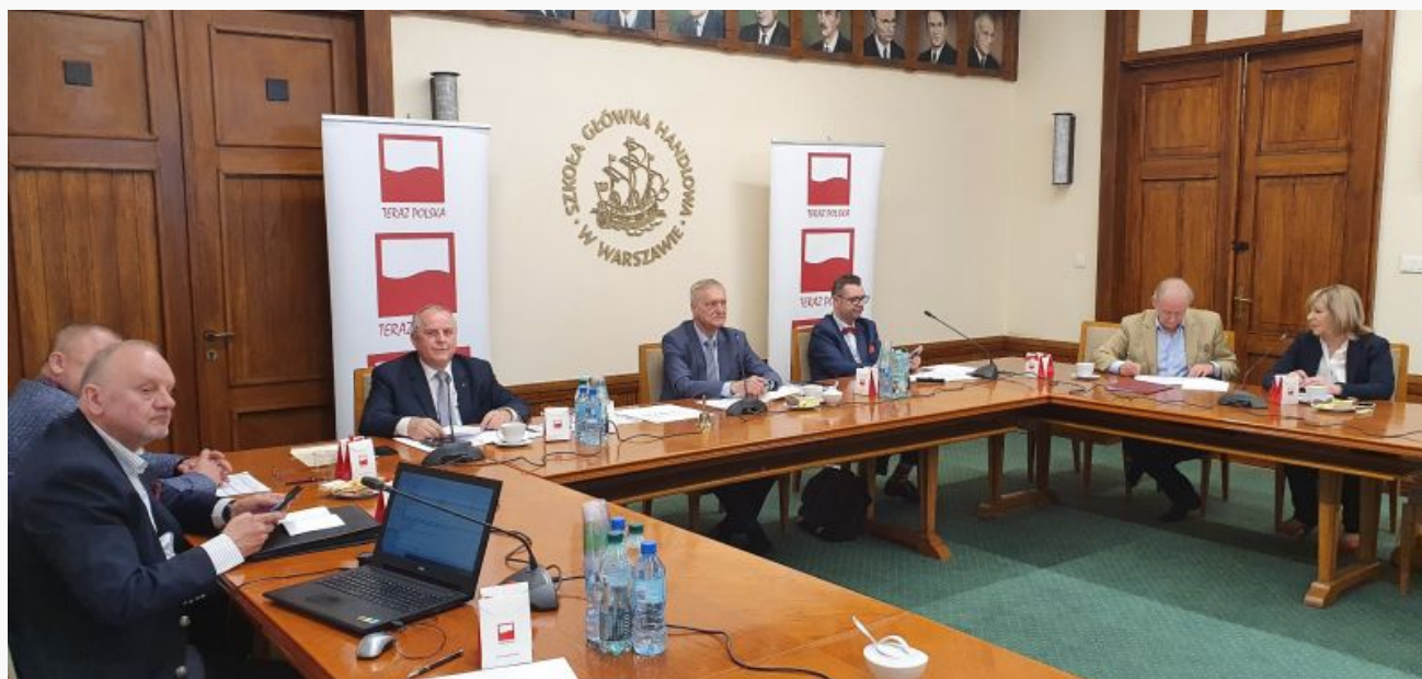
obrady kapituły godła teraz polska (2)

31 produktów, 20 usług i 2 innowacje uzyskały nominacje w 30. edycji Konkursu „Teraz Polska”. Tegoroczna edycja Konkursu odbywa się mimo pandemii koronawirusa i lockdownu gospodarczego i społecznego. Po raz pierwszy Kapituła Godła „Teraz Polska” obradowała online.