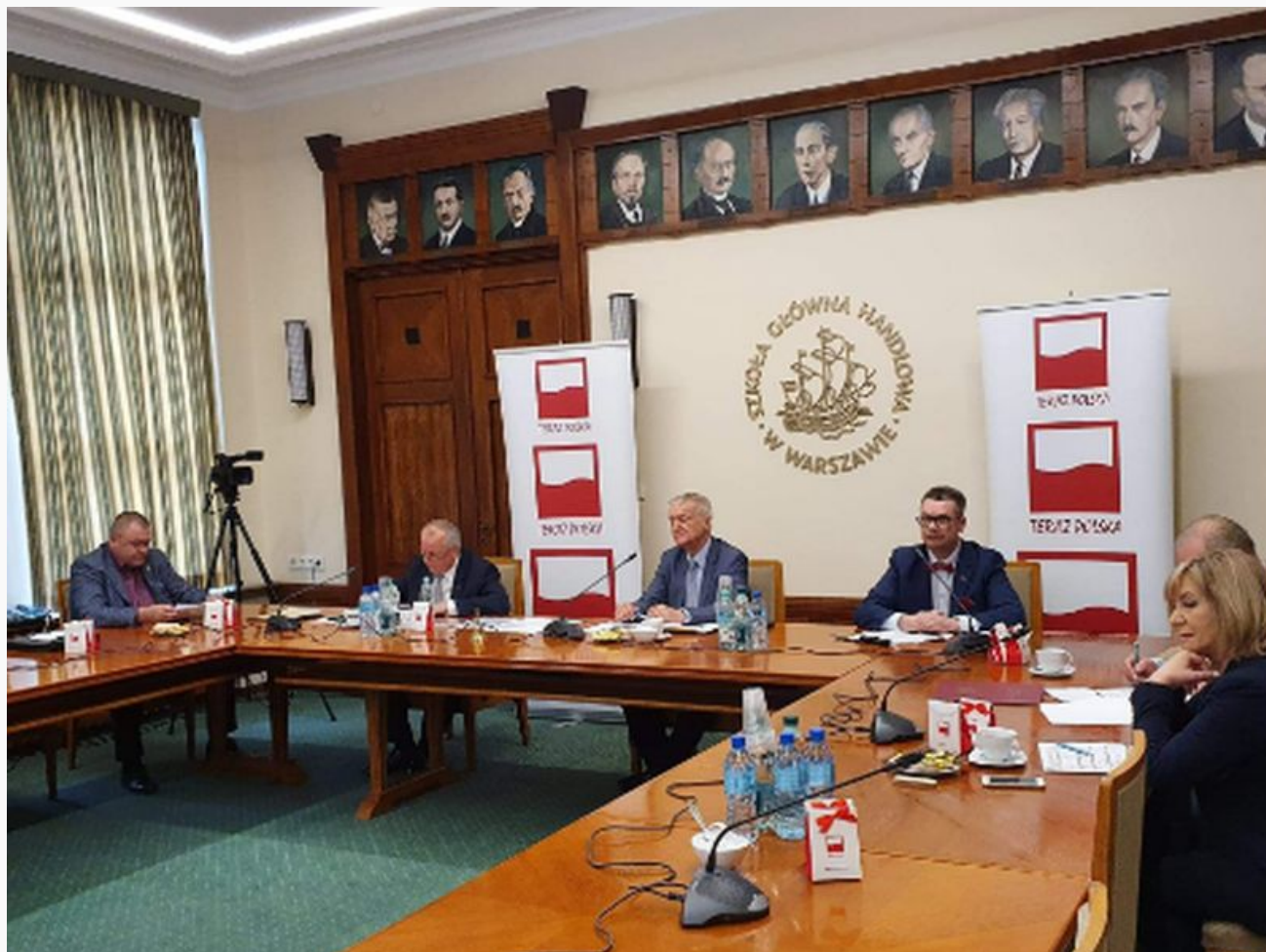
kapitula godla teraz polska obrady online

Ogłoszono nominowanych w 30. edycji Konkursu „Teraz Polska”!