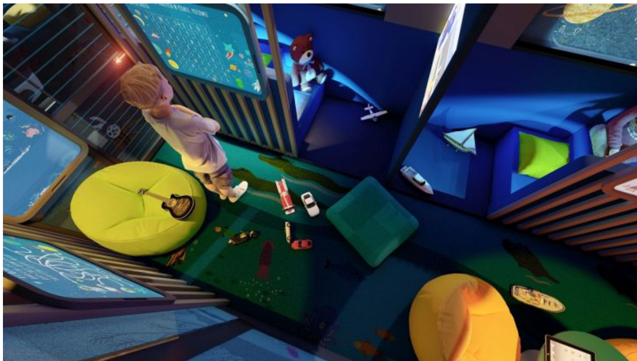
PKP Intercity wizualizacja nowe wagony COMBO

Nawet 450 nowych wagonów dla PKP Intercity. Umowa podpisana