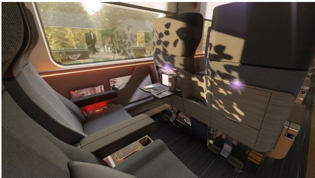
PKP Intercity wizualizacja nowe wagony