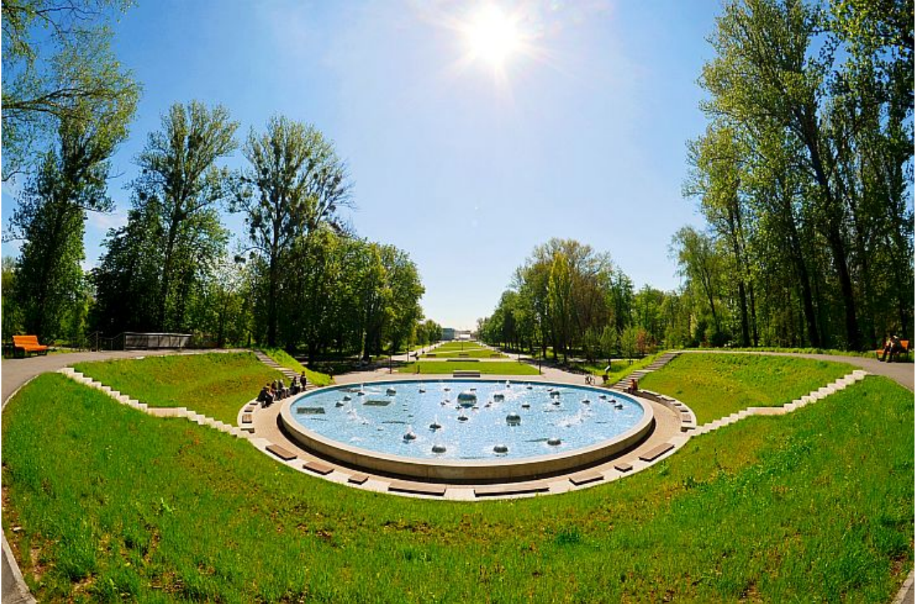
Park Ludowy w Lublinie po rewitalizacji (2)

Ocena dotyczyła także obszarów bardziej odległych od drzewostanu i zieleni, jak transport publiczny, a właściwie jego transformacja w kierunku rozwiązań bezemisyjnych. W rankingu czytamy: „Lublin inwestuje nie tylko w wymianę autobusów napędzanych silnikiem spalinowym, ale także w trolejbusy i jest liderem elektromobilnej rewolucji, jaka odbywa się w polskich miastach. Dlatego chociaż ustawa o elektromobilności i paliwach alternatywnych na samorządy nakłada w tym roku konieczność posiadania 5 proc. udziału autobusów elektrycznych w całej flocie, to Lublin z dużym zapasem sięgnął tego pułapu, bo już teraz 30 proc. pojazdów jest zasilanych bateriami. To wynik, który stawia Lublin w ścisłej czołówce w całej Europie”.