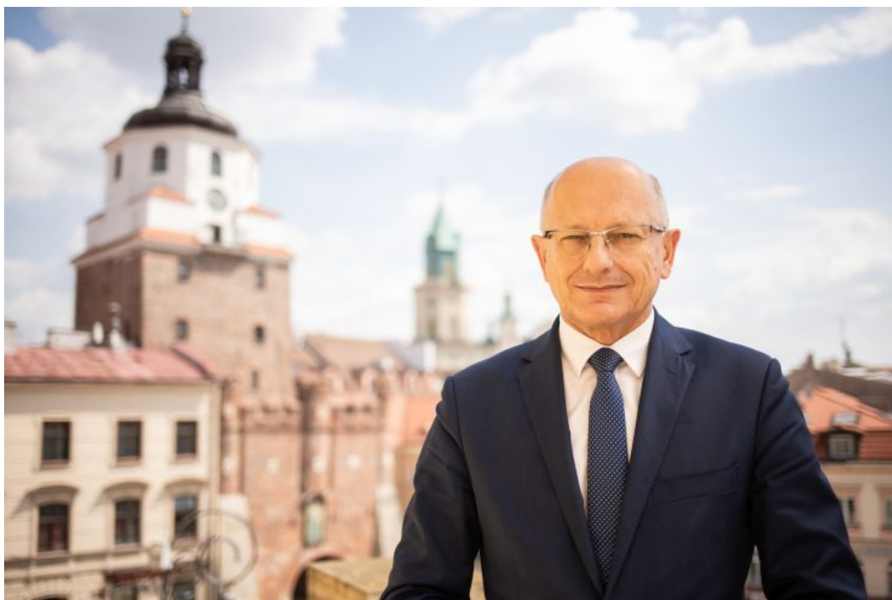
Prezydent Miasta Lublin Krzysztof Żuk

Rozbudowa i modernizacja sieci miejskich dróg, inwestycje infrastrukturalne oraz te z zakresu rewitalizacji, zarządzanie przestrzenią planistyczną, nowoczesna komunikacja miejska, rozwój sieci infrastruktury rowerowej, elektromobilności, a nawet mikromobilności, oraz inteligentne rozwiązania w zakresie obsługi mieszkańców - to najważniejsze obszary i kierunki rozwoju inwestycyjnego Lublina na przestrzeni ostatniego dziesięciolecia.