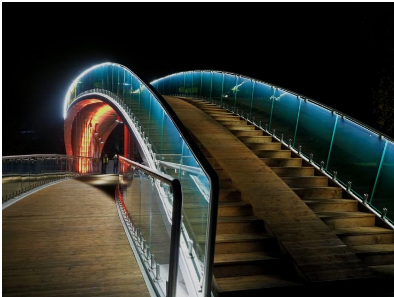
Kładka w Parku Ludowym w Lublinie

Środki europejskie wspierają także rozwój miasta w innych obszarach, pozwalają m.in. na realizację projektów zwiększających dostępność e-usług w administracji publicznej. Dziś Lublin posiada największe samorządowe centrum informatyczne we Wschodniej Polsce. Dzięki temu Miasto może świadczyć e-usługi, w tym geodezyjne, udostępniać Geoportal Miejski i Model 3D tkanki miejskiej. Lublin też był pierwszym miastem w Polsce, w którym w stanie epidemii wszystkie placówki oświatowe przeszły integrację e-dziennika z pakietem narzędzi do zdalnej nauki i komunikacji.