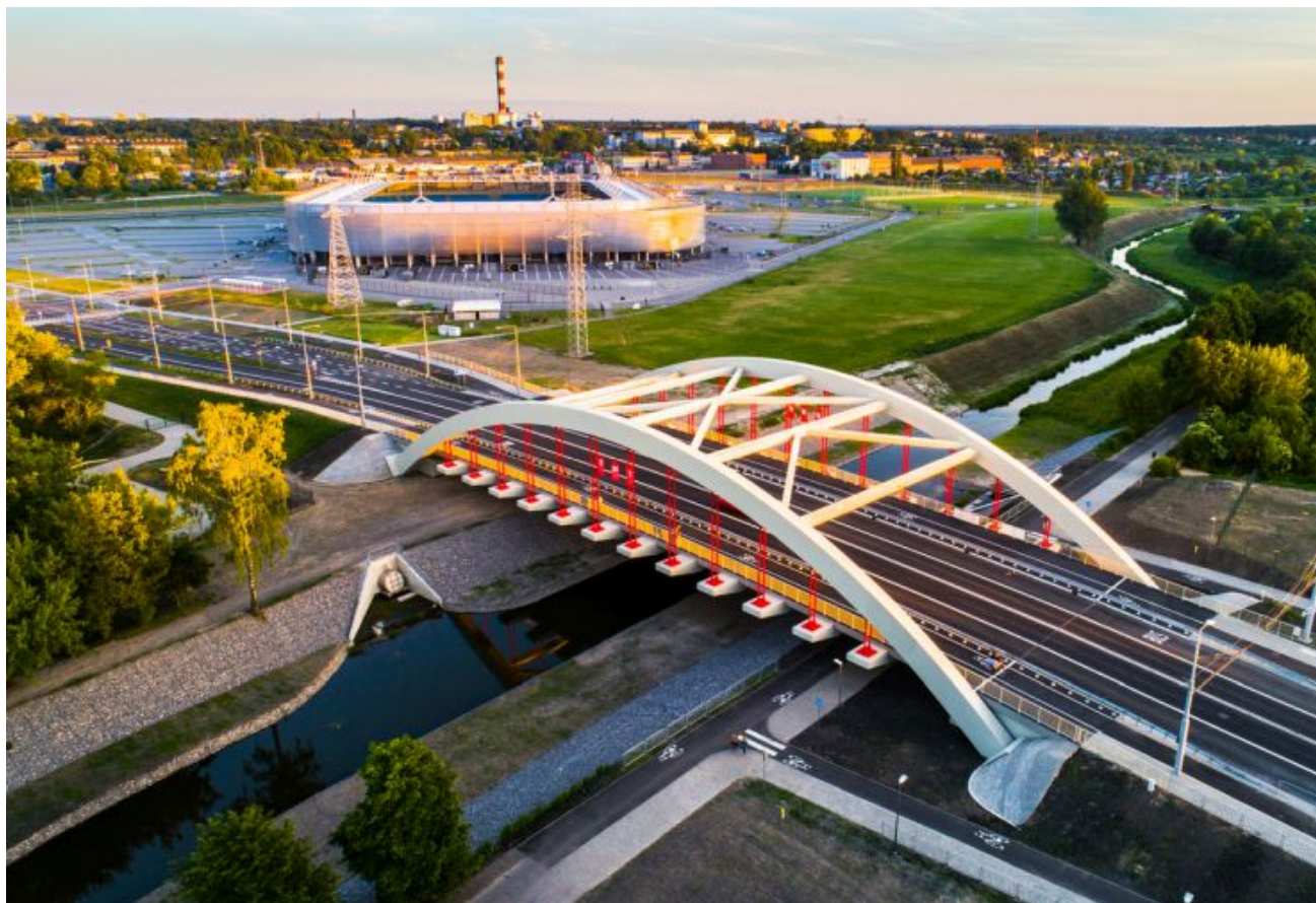
Most 700-lecia w Lublinie

integrującego transport dla potrzeb Lubelskiego Obszaru Funkcjonalnego.