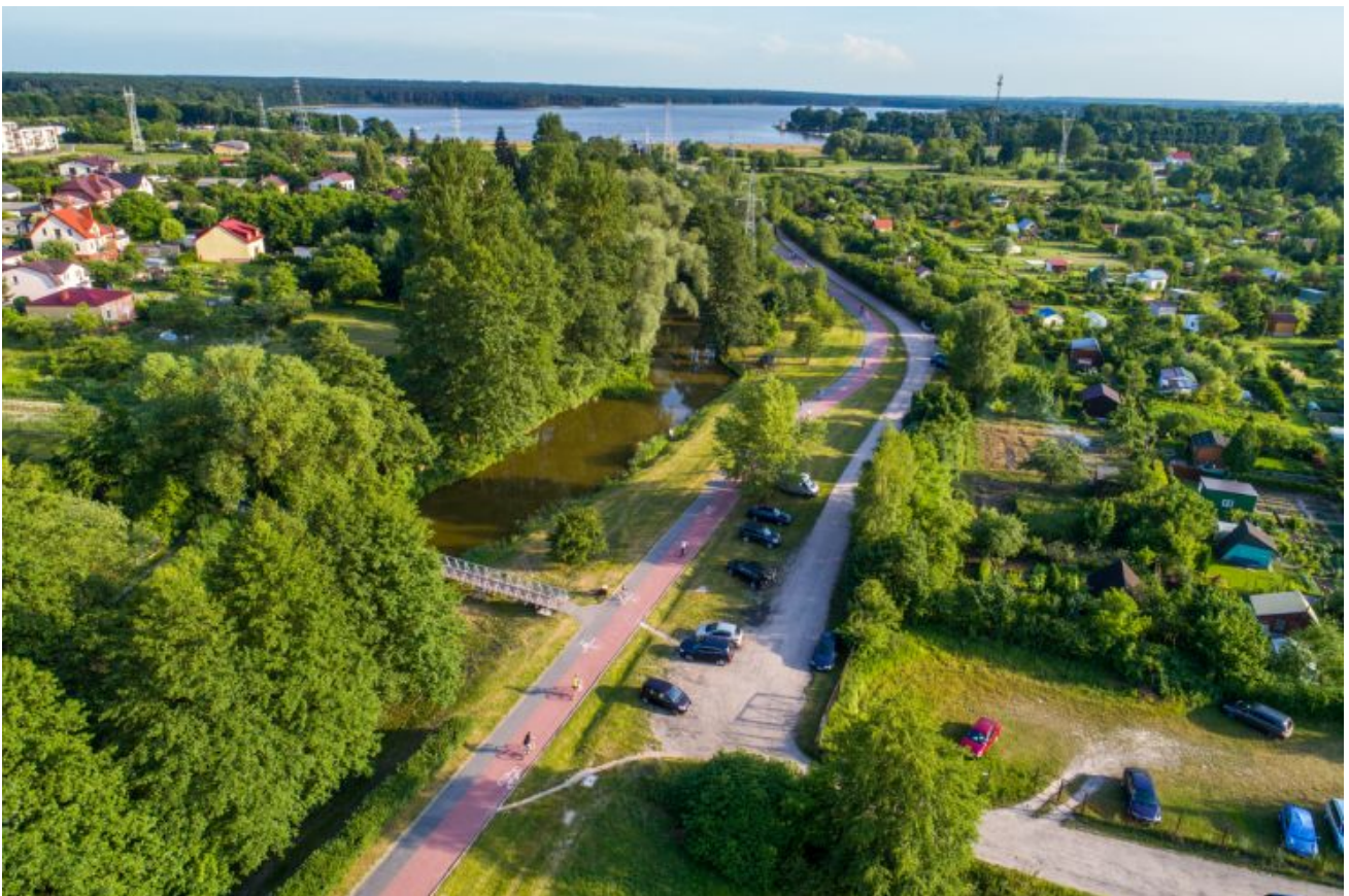
Tereny zielone nad Bystrzycą, ścieżki rowerowe (2)

W latach 2010-2020 Lublin realizował także projekty z zakresu zrównoważonego rozwoju w obszarze środowiska i miejskiej zieleni. To 72 ha nowych i zrewitalizowanych terenów zieleni – parków, skwerów, łąk kwietnych, zieleńców i nasadzeń. To również ochrona cennych przyrodniczo wąwozów, realizacja projektów ekologicznych, walka ze smogiem, usuwanie azbestu, leczenie starodrzewu, ratowanie kasztanowców, a także zapobieganie skutkom suszy, czego przykładem jest nowy Program ochrony zasobów wodnych. Miasto Lublin jako pierwsze miasto w Polsce, wprowadziło również Zielony Budżet z propozycjami mieszkańców dotyczącymi zieleni miejskiej, w którym przez cztery edycje zrealizowano ponad 60 projektów.