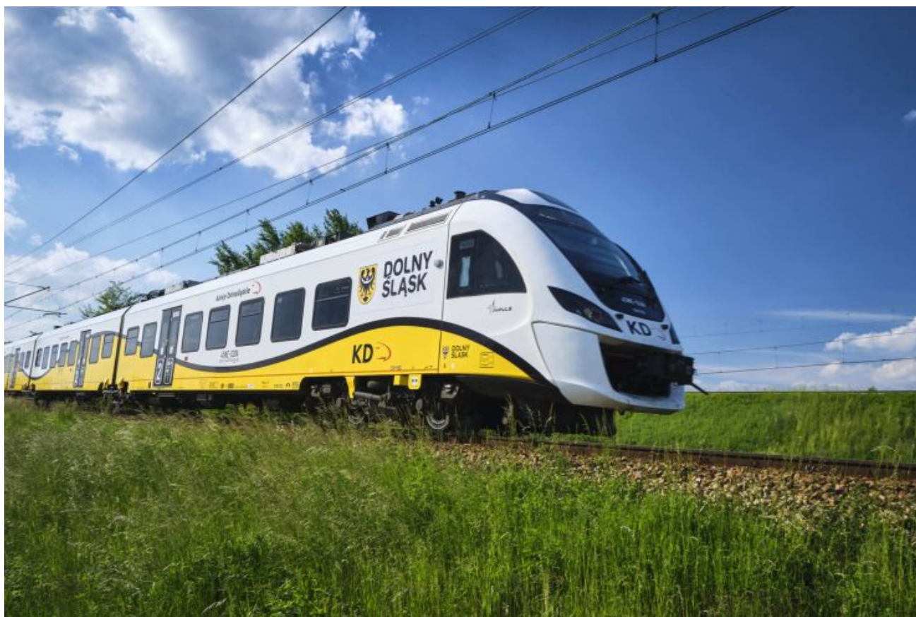
pociąg KD, podróż do Czech

Koleje Dolnośląskie uruchomiły internetową sprzedaż biletów na połączenia do północnych Czech. Poprzez platformę KOLEO pasażerowie mogą nie tylko skorzystać z oferty KD, ale także kilku czeskich przewoźników. Tym samym podróż do popularnych przygranicznych atrakcji turystycznych stała się jeszcze łatwiejsza.