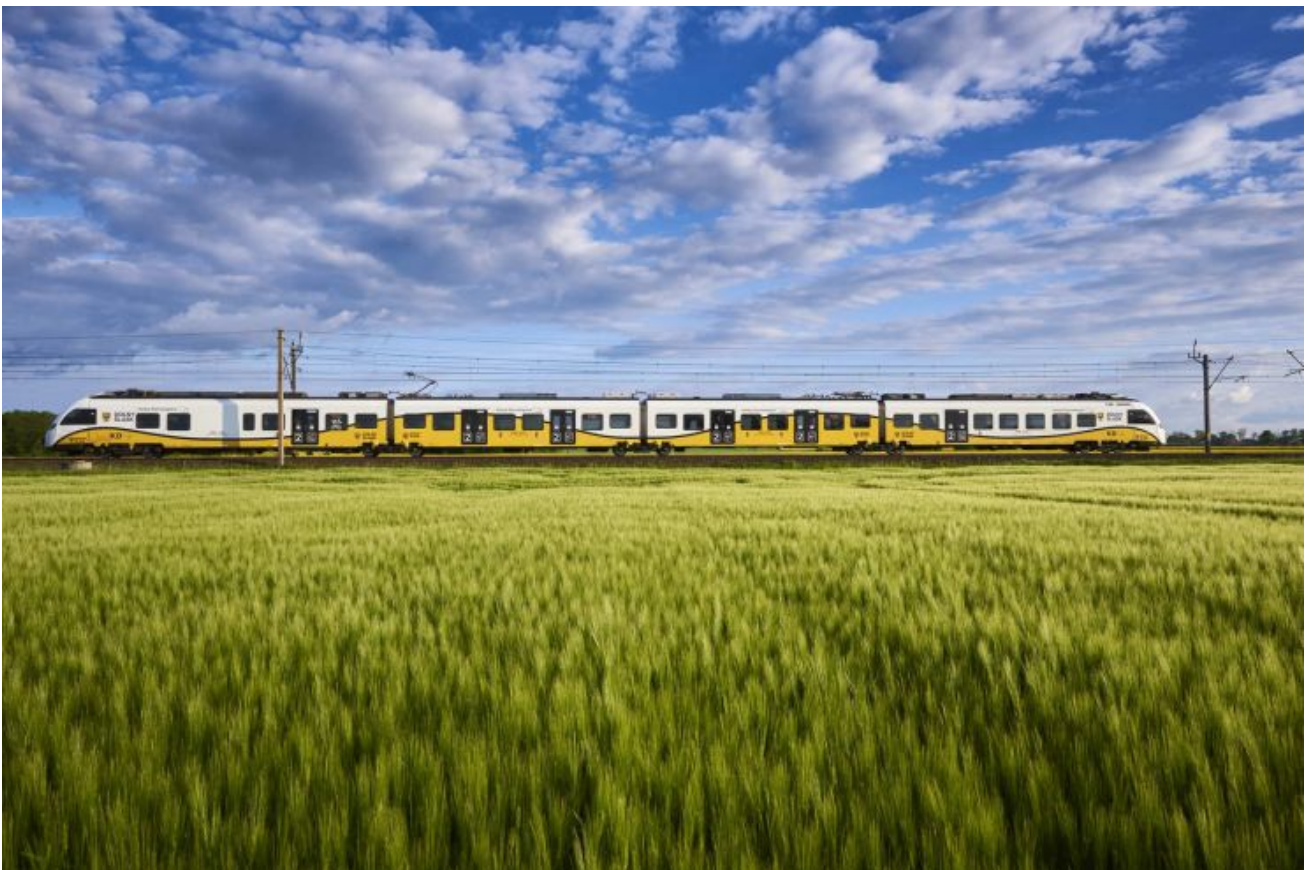
pociąg KD, podróż do Czech

Teraz, podczas ostatnich tygodni lata, turystyczna wyprawa do Czech będzie jeszcze łatwiejsza. Koleje Dolnośląskie uruchomiły bowiem internetową sprzedaż biletów na połączenia do północnych Czech – poprzez platformę KOLEO.