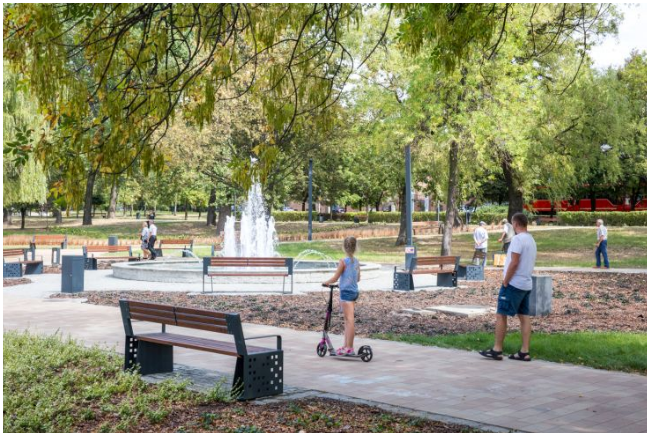
Skwer w Katowicach

W dwóch dotychczasowych edycjach Zielonego Budżetu mieszkańcy złożyli łącznie 292 projekty, z których do realizacji przeznaczono 143, na łączną kwotę prawie 5 milionów złotych. Wśród zrealizowanych już projektów znalazły się chociażby: urządzenie zielonego skweru przed Superjednostką, nowe nasadzenia drzew, krzewów i bylin m.in. w Bogucicach, na osiedlu Paderewskiego czy Kokocińcu, łąki kwietne na os. Tysiąclecia, ogród deszczowy na Bażantowie, zakupy i montaż budek lęgowych dla ptaków na terenie Ligoty-Panewnik czy zajęcia o charakterze edukacyjnym w szkołach.