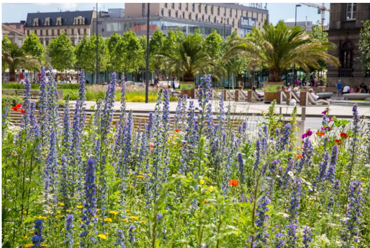
Zieleń w Katowicach

Aż 222 pomysły zgłosili katowiczanie w ramach trzeciej edycji Zielonego Budżetu. To rekordowy wynik. Właśnie zakończył się etap formalnej weryfikacji zgłoszonych propozycji. Te wnioski, które go przeszły, zostaną teraz poddane weryfikacji merytorycznej, która zakończy się 31 sierpnia.