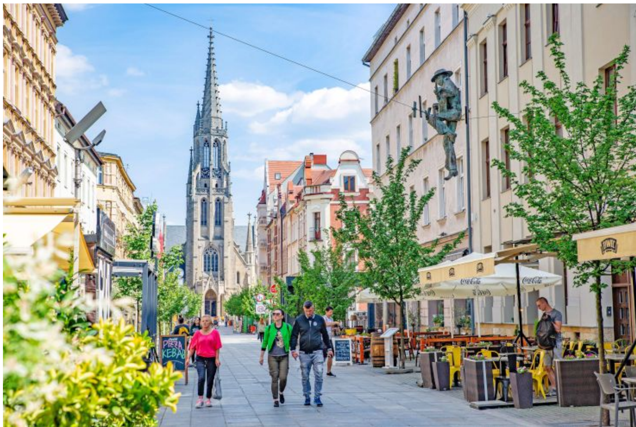
Ulica Mariacka w Katowicach