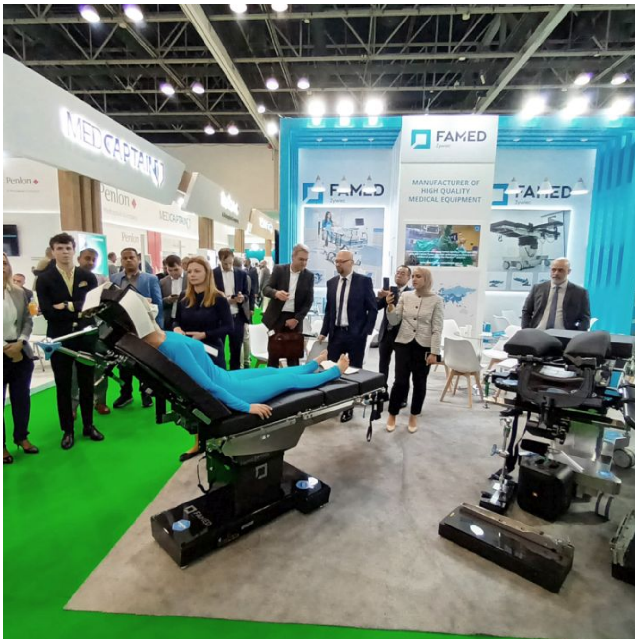
Famed ARTHERO (2) Arab Health 2023

- Wielokrotnie nasi partnerzy eksportowi prosili o polecenie firm z Polski,