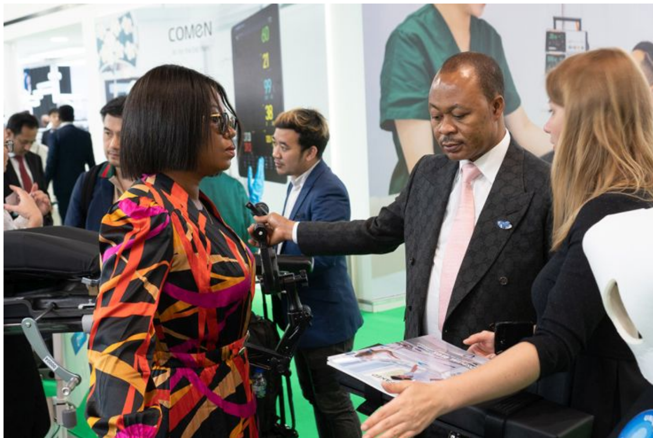
Arab Health 2023