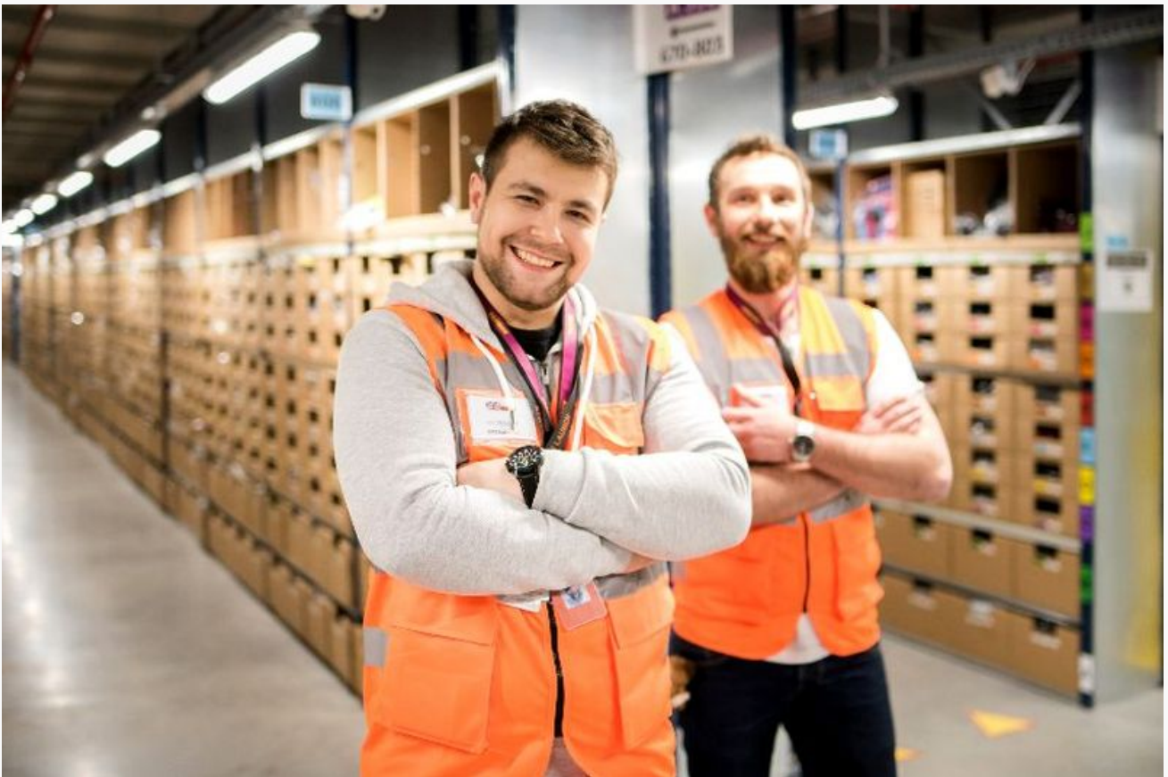
amazon sosnowiec

Już od września br, firma Amazon zapowiada podwyższenie płac swoim pracownikom we wszystkich pięciu polskich Centrach Logistyki E-Commerce (we Wrocławiu, Sosnowcu, Kołbaskowie koło Szczecina oraz Poznaniu ). We Wrocławiu pensje wzrosną nawet o 15.6%. W zależności od stażu w firmie, płace pracowników poziomu początkowego kształtują się na poziomie od 18,5 do 19,5 PLN/h a kierownicy zespołów otrzymują od 23,5 do 24,5 PLN/h.